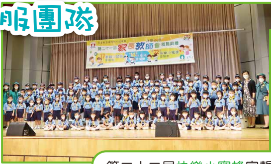
第二十二屆快樂小蜜蜂宣誓禮