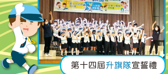
第十四屆升旗隊宣誓禮