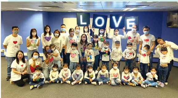
▲ 參與眾家之家籌款音樂會