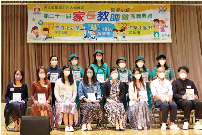
▲ 第二十一屆家長教師會(匯愛小組)就職典禮